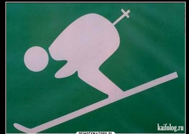
Obraza uczuć religijnych